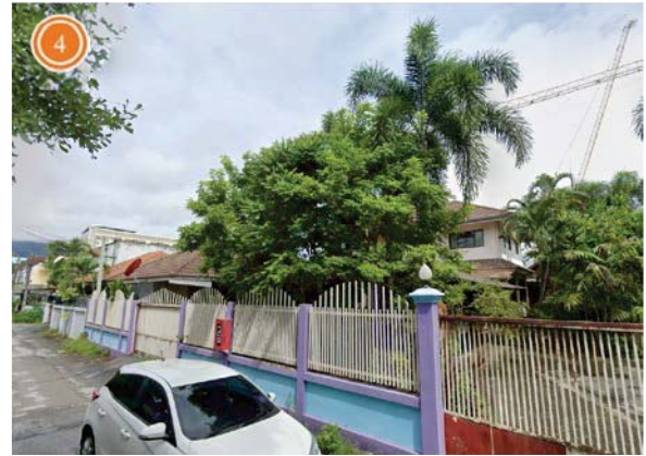
บ้านพักอาศัย ด้านทิศใต้ของโครงการ