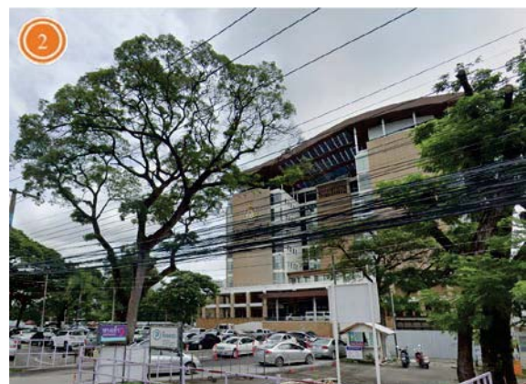
อาคารศูนย์ความเป็นเลิศทางการแพทย์