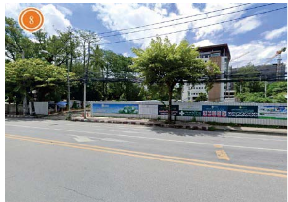
ถนนสุเทพ