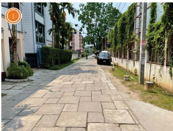
ซอยเชิงคำด้านทิศตะวันออกของโครงการ